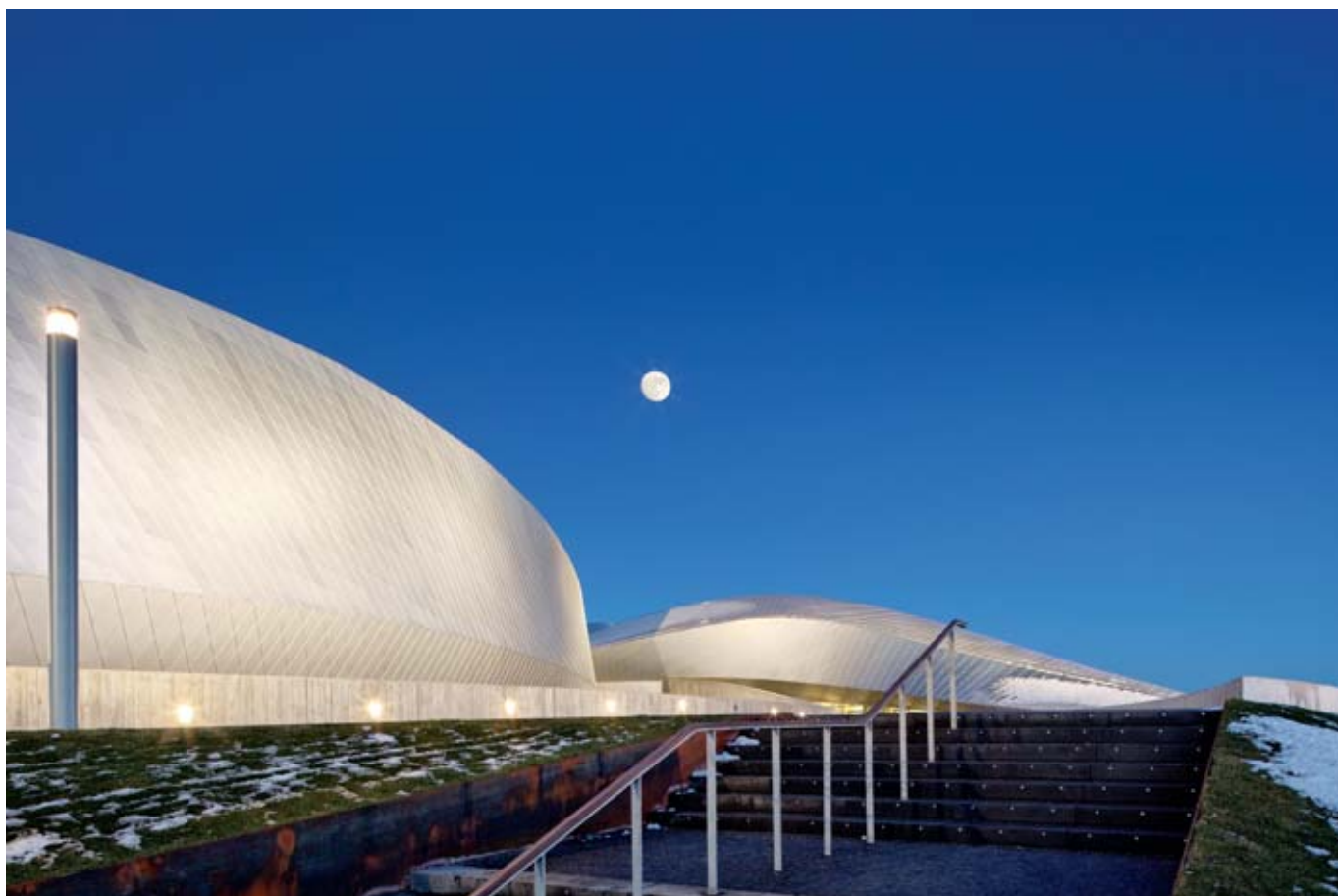
Den Blå Planet i Kastrup.

gaard Holding A/S og dermed i entreprenørvirksomheden MT Højgaard A/S. Bestyrelsesmedlemmerne i disse selskaber er ikke medlem af Knud Højgaards Fonds bestyrelse. Fonden lægger vægt på, at Højgaard Holding A/S har en kvalificeret bestyrelse. Fondens interesse varetages på generalforsamlingen i Højgaard Holding A/S og ved møder med formanden for Højgaard Holding A/S.