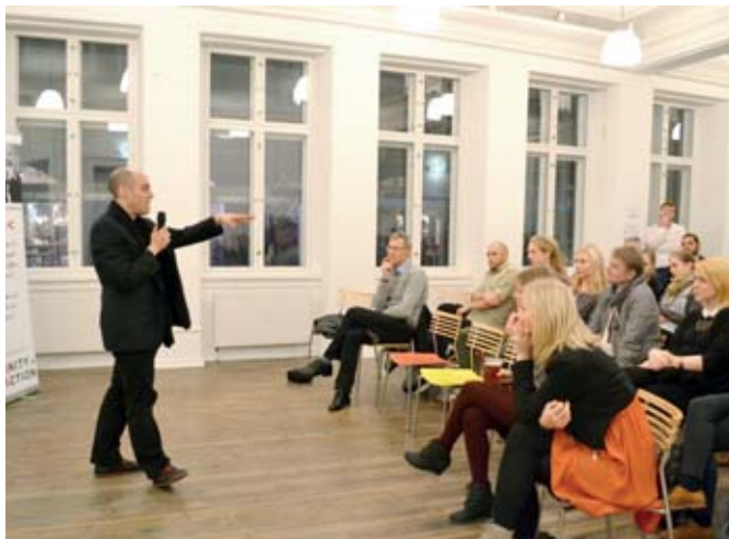
Under filmfestivalen CPH:DOX arrangerede Humanity in Action en særvisning af "The Act of Killing", en film om en indonesisk dødspatrolje, og en debat med instruktør Joshua Oppenheimer. Filmen endte med at vinde festivalens hovedpris.

Der er menneskerettigheder og minoriteter på skemaet, når Humanity in Action hvert år sender en lille flok ambitiøse unge på fem ugers sommerakademi. Her samler de viden, deler aha-oplevelser og skaber et internationalt netværk for livet.