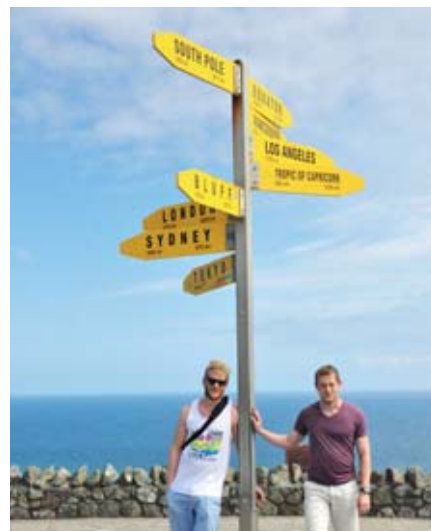
Der blev tid til en weekend-tur ud i landet med en tysk medstuderende.