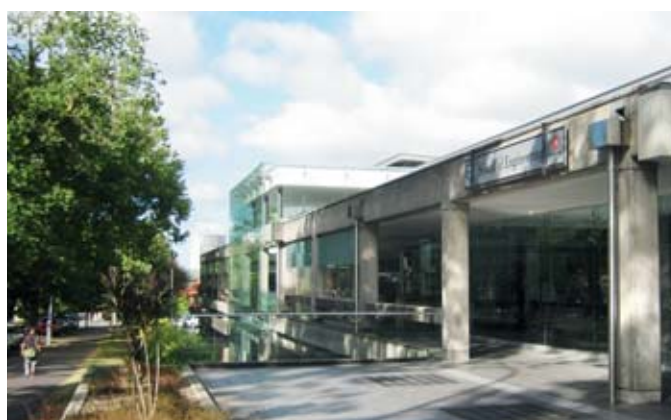
University of Auckland er landets største universitet, og det ingeniørvidenskabelige fakultet er internationalt anerkendt for sin forskning og undervisning.

på DTU, hvor man har mest fokus på indholdet. Det synes jeg var spændende, og samtidig et godt redskab i forbindelse med mit forestående speciale,” siger han.