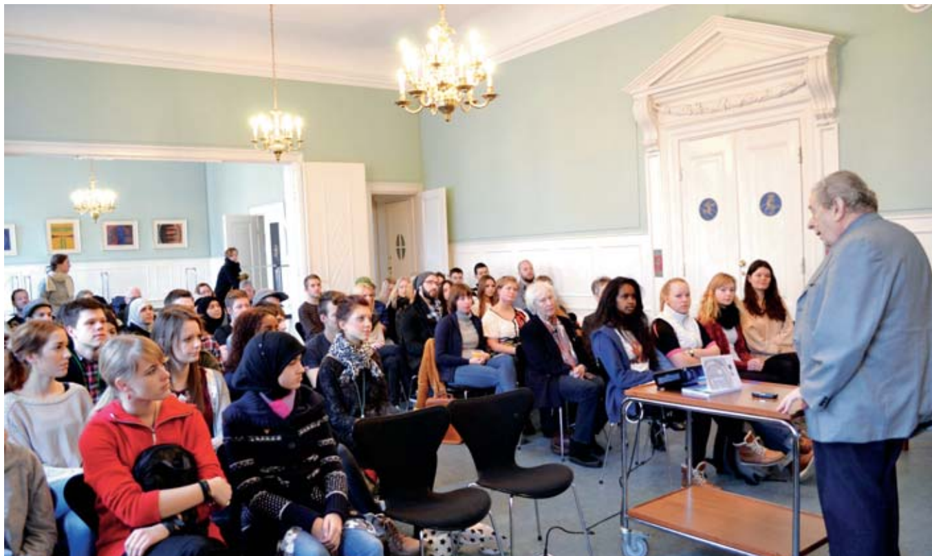
Foreningen arrangerer også forskellige foredrag og debatter. Her taler tidligere overrabbiner Bent Melchior til en gruppe gymnasieelever under et debatseminar om flugt og folkedrab.

mand. Men at opleve, hvordan folk så på en, hvordan man mærkede, at man var anderledes. Det slog mig fuldstændig bagover,” forklarer han.