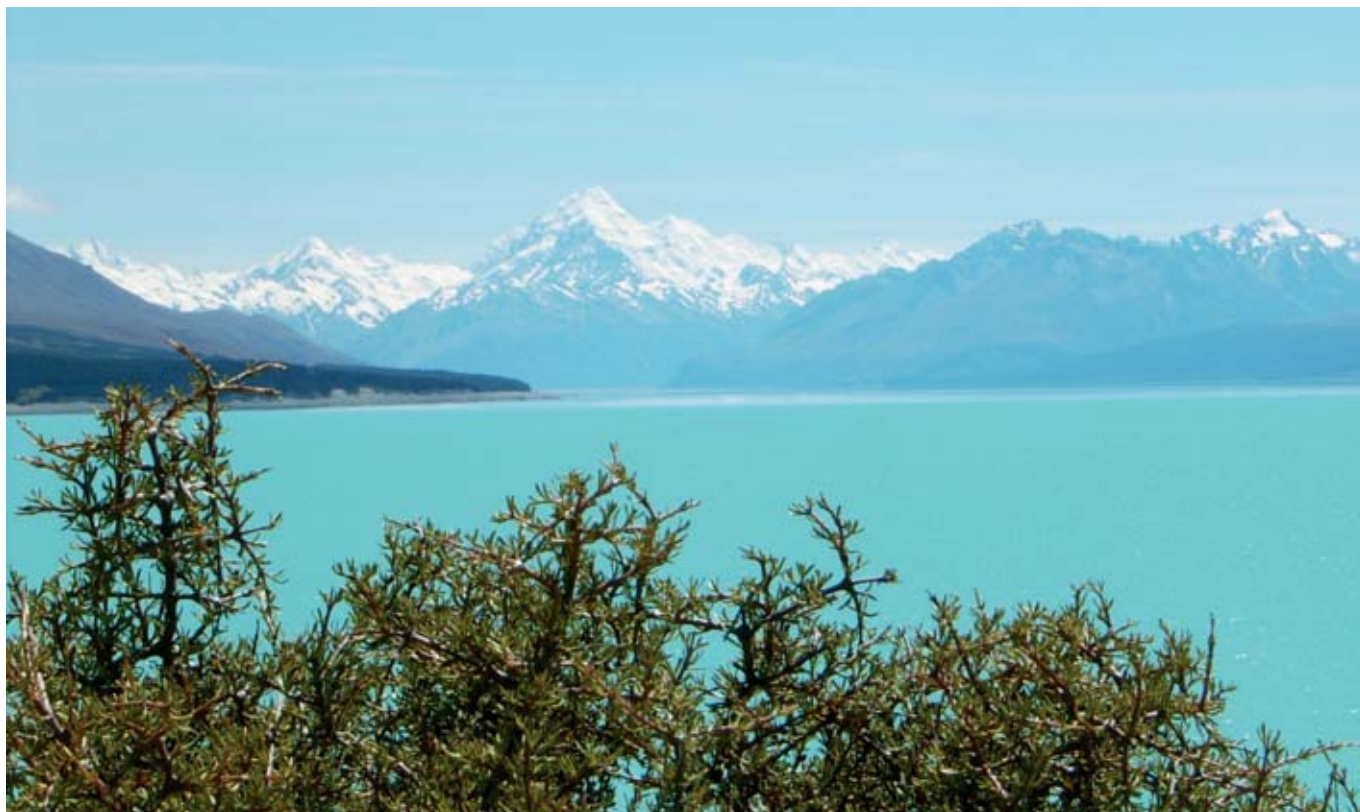
Lake Tekapo med Mount Cook i baggrunden.

“Jeg lærte nogle ting om skrive teknik, som jeg slet ikke har arbejdet med