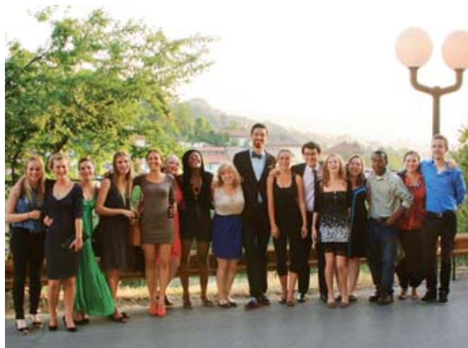
Sommerakademiet afsluttes hvert år med en international conference. I 2012 var deltagerne i Sarajevo, hvor de blandt andet hørte Bill Clinton tale om folkedrab og humanitær intervention.

Mens nogle unge bruger deres sommerferie på en strand i Ibiza, et diskotek i Sunny Beach eller en mudret mark uden for Roskilde, så er der andre, der bruger juni måned på foredrag, research og dilemmaspil. Det er ganske frivilligt – faktisk er der stor rift om pladserne, når Humanity in Action hvert år samler en lille flok unge fra Danmark og udlandet for at diskutere menneskerettigheder, social retfærdighed og demokrati.