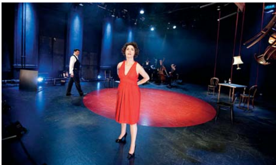
I 2012 stod festivalen selv for opsætningen af den surrealistiske tango-opera 'Maria de Buenos Aires', som fortalte om den prostituerede Marias liv gennem ballet, tango, sang og rap.

Festivalens grundtanke er at bringe operaen ud til de mennesker, som ikke normalt afsætter 870 kroner til en billet i Det Kongelige Teater, og derfor forsøger man at holde billetprisen nede på et niveau, hvor alle kan være med. Det gør man ved hjælp af støtte fra forskel-