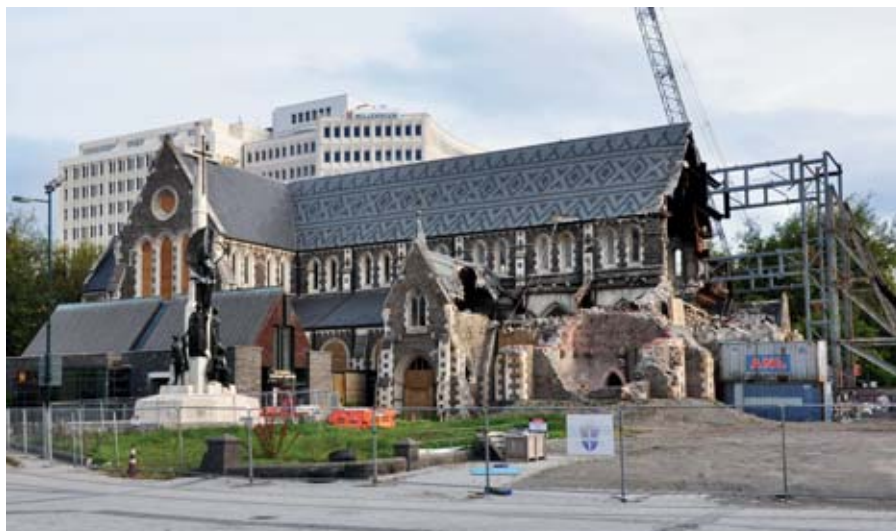
I New Zealand må bygningsingeniørerne tage højde for de kraftige jordskælv, der rammer området. Her ses katedralen i Christchurch, som blev ødelagt af jordskælvet i 2011.